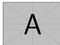
(b) Sous figure 2