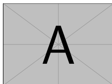
FIGURE I.1.1 – Une figure simple.